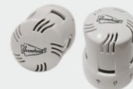
ТЕРМОСТАТИЧЕСКИЕ ЭЛЕМЕНТЫ И КЛАПАНЫ