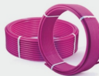
РЕХ ТРУБА ARROWHEAD