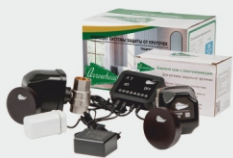
СИСТЕМА ЗАЩИТЫ ОТ ПРОТЕЧЕК

Наша продукция – это незамерзающие краны, пуш-фитинги, системы защиты от протечек и другое оборудование инженерной сантехники из бессвинцовой латуни.