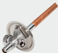
НЕЗАМЕРЗАЮЩИЕ УЛИЧНЫЕ КРАНЫ