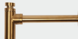
СИФОНЫ И ДОННЫЕ КЛАПАНЫ